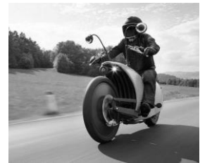
Motos & Scooters