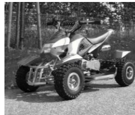
Véhicules de loisir