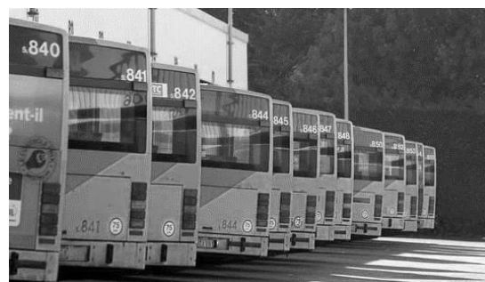
Pour utilisation en dépôt