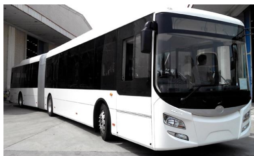
Pour tout type d'eBus