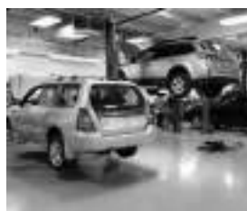
Ateliers & Garages