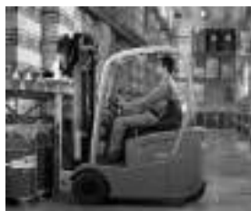
Chariots de manutention