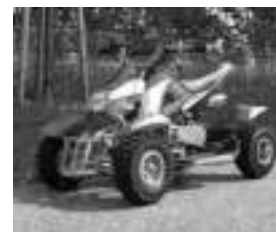
Véhicules de loisirs