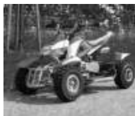
Véhicules de loisirs