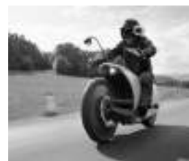
Motos & Scooters